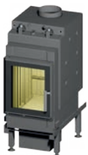
Renova A H 2 O